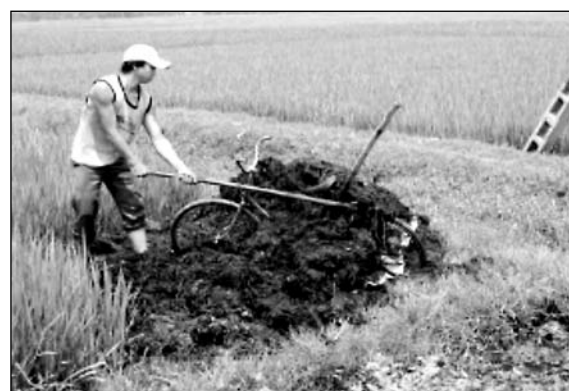
Hình 2: Phân ủ bón cho lúa.

Một trong những phương pháp truyền thống đã được người nông dân áp dụng rộng rãi đối chất thải từ chăn nuôi lợn là độn rom rạ với phân chuồng kết hợp trộn với bột trước khi tiến hành ủ, thời gian ủ thường kéo dài từ 4-6 tháng. Với phương pháp này có thể hạn chế tối đa những mầm bệnh bởi nhiệt độ cao sinh ra trong quá trình ủ, và nhờ nhiệt độ cao mà các chất độn được phân huỷ nhanh hơn. Tuy nhiên, mặt trái của nó là nhiệt độ cao sẽ làm bay hơi đạm trong phân chuồng, dẫn đến chất lượng giảm. Biện pháp duy nhất để tránh sự bay hơi của đạm trong suốt thời gian ủ thì phân ủ phải tấp đống lại và bôi kính bùn bên ngoài đống phân.