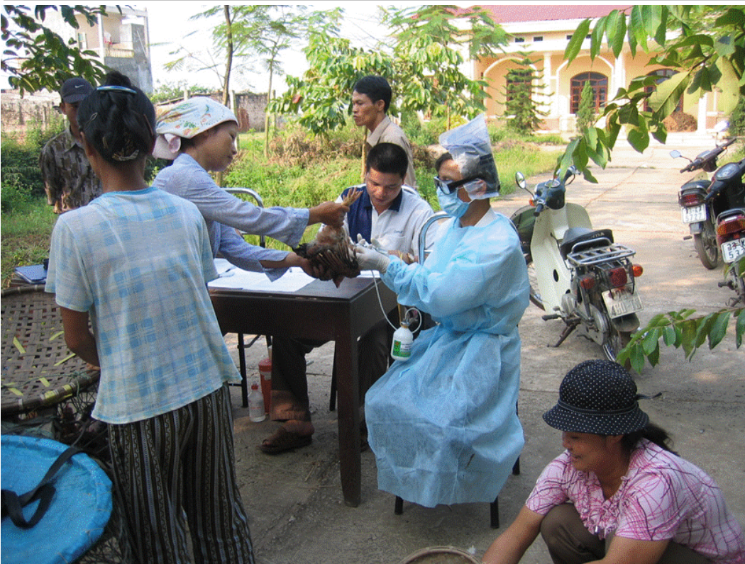
Ảnh: Tiêm phòng Cúm gia cầm tại xã Đắc Sở - Hoài Đức